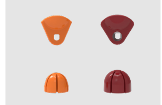
Kits de exprimido

Mediano (M): Naranja; Grande (L): Granate.