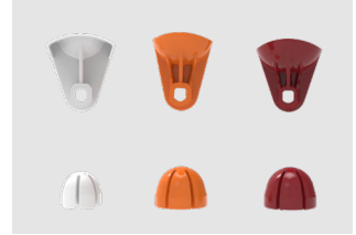
Kits de exprimido

Pequeño (S): Gris; Mediano (M): Naranja; Grande (L): Granate.