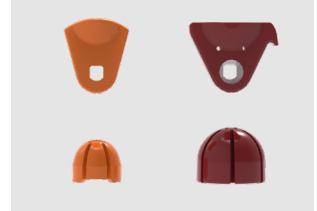
Kits de exprimido

Mediano (M): Naranja; Grande (L): Granate.